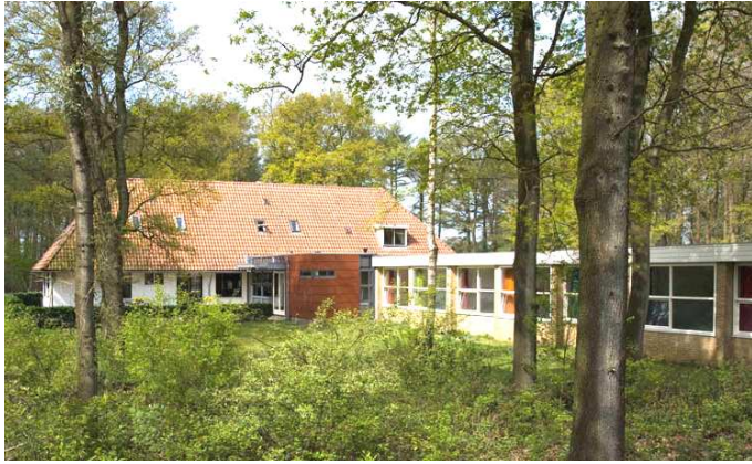
Nieuw Allardsoog ( www.nieuw-allardsoog.nl )

Van zondag 22 (13:00 uur) t/m zaterdag 28 juli (15:00 uur) 2012.