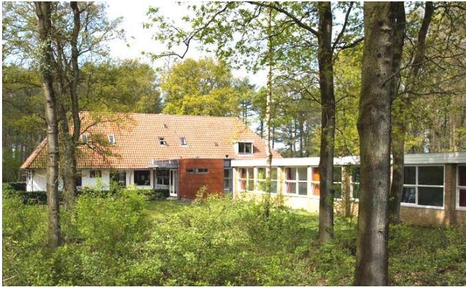
Nieuw Allardsoog ( www.nieuw-allardsoog.nl )

Sonntag, 22.7. (ab 13:00 Uhr), bis Samstag 28. Juli (bis 15:00 Uhr) 2012.